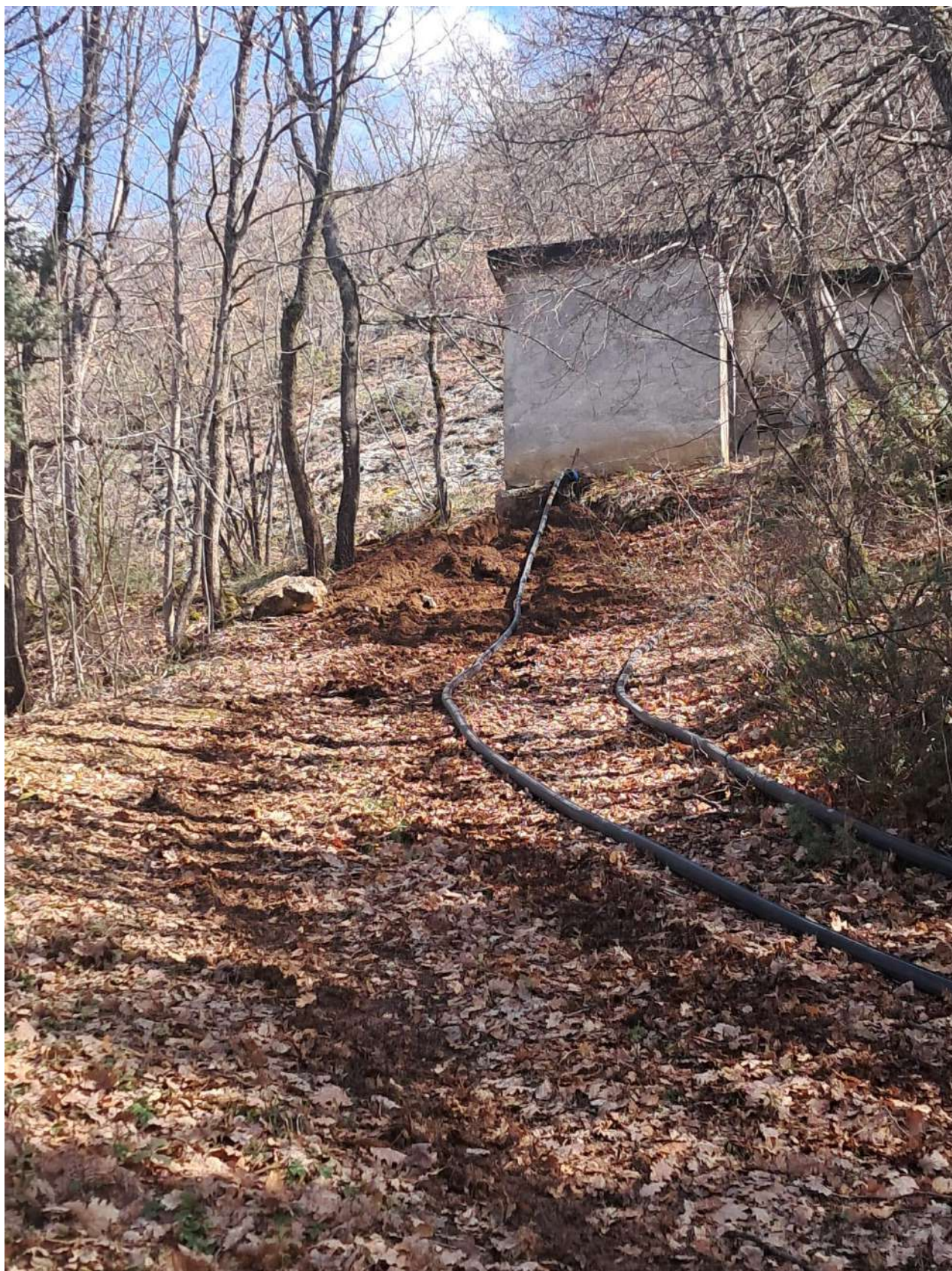
Figura 6. Visuale del punto di intervento ( cono n.5 )