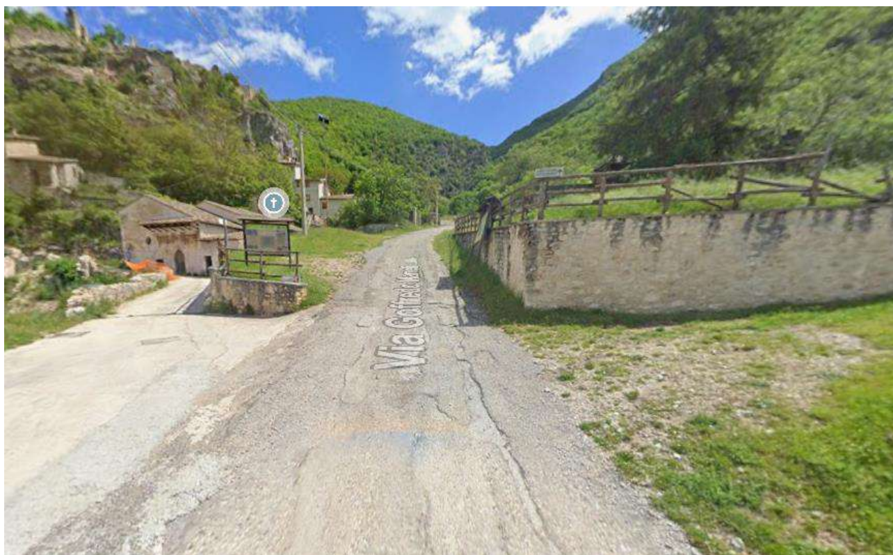
Figura 2. Vista del punto di intervento ( cono n.1 , immagine da Google Maps)