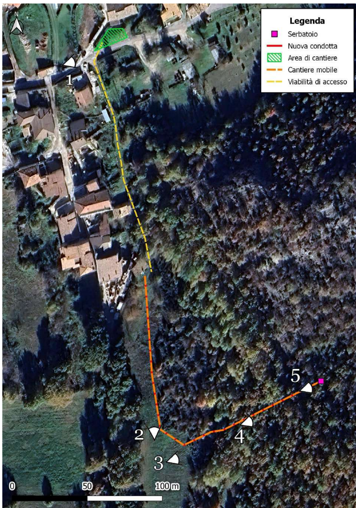
Figura 1. Ortofoto dell'area di intervento e posizione dei coni visuali.