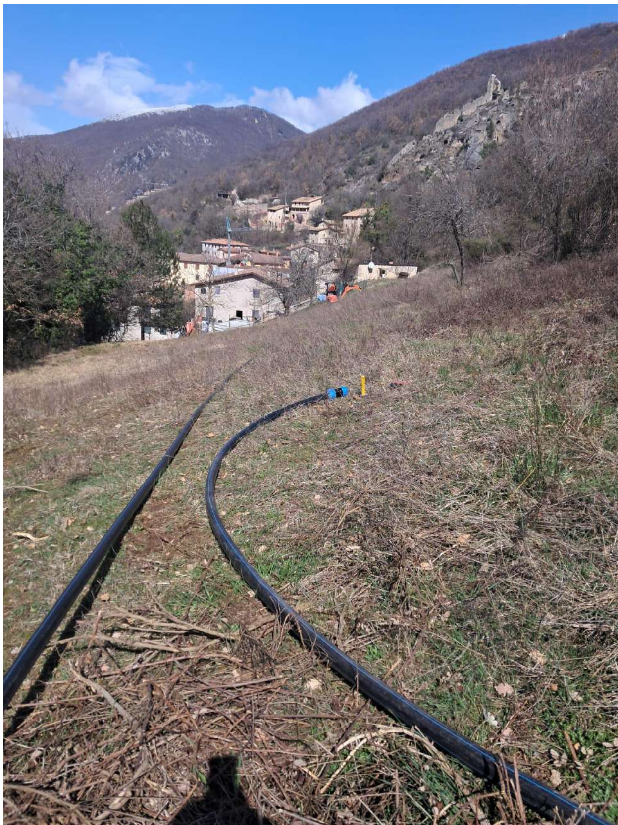
Figura 3. Visuale del punto di intervento ( cono n.2 )