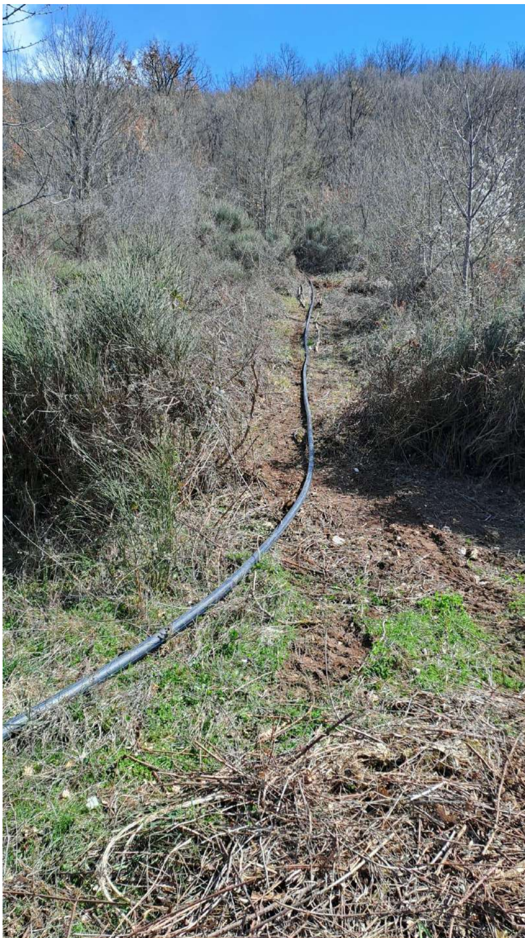
Figura 4. Visuale del punto di intervento ( cono n.3 )